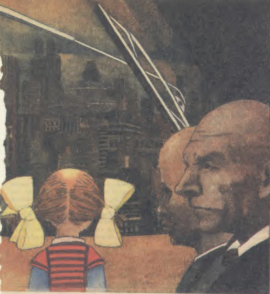
Ilustrował: Bogusław Orliński

zakończeniu, trzy ostatnie zdania, stanowiące jak gdyby abstrakcyjne uzasadnienie wyводу: „... Ciśnienie opinii społecznej nadal zbyt mocno określa nasze życie, nadaje mu pozór normalności lub skazuje na potępienie. Jedyne w teorii każdy ma prawo postępować według własnej skali wartości, od początku do końca tworzyć swój własny los. W rzeczywistości wyboru nigdy nie dokonujemy samotnie, czasami dokonujemy go w mniejszości, lecz jeśli jest on obiektywnie słuszny, stanie się prędzej czy później wyborem całej ludzkości”.